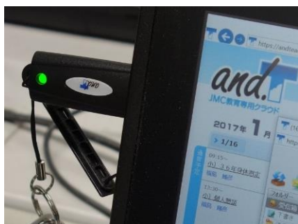
▲ システムを利用するのに 必要な「and.T認証USBキー」

「先生同士の情報交換をもっと便利にしたい」「先生方の成績処理の負担を軽減させたい」そんな思いから、能勢町教育委員会はグループウェアや校務支援システムの導入に向けて検討を進めました。「さまざまなグループウェアについて調べました。先生方が必要とするメール機能やスケジュール管理機能、掲示板機能などは、どのグループウェアでも実現できそうだと感じました。問題は、限られた予算で、いかにセキュリティを確保するか。バランスが重要でした」。