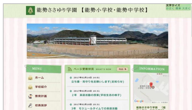
▲ 能勢小学校・能勢中学校の学校ホームページ

学校ホームページは「and.T学校Webライター」を利用して作られました。「学校からのお知らせや子供たちの活動の様子が毎日のように更新されています。『誰でも手軽に更新できる』と先生からの評判も良く、学校連絡網と合わせて情報発信に活用されています」(岡村氏)。